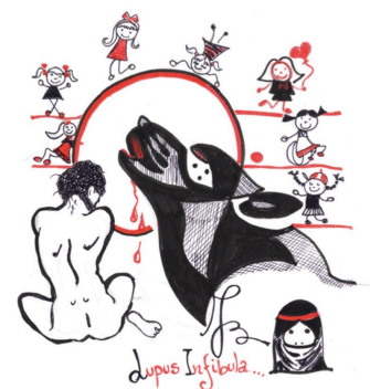
la pietra dello scandalo maschile uccide attraverso il giudizio sulla donna: condannata a morte