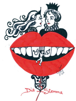
Frattura saldata tra genitori e figli

La differenza fra sistema animale e sistema uomo